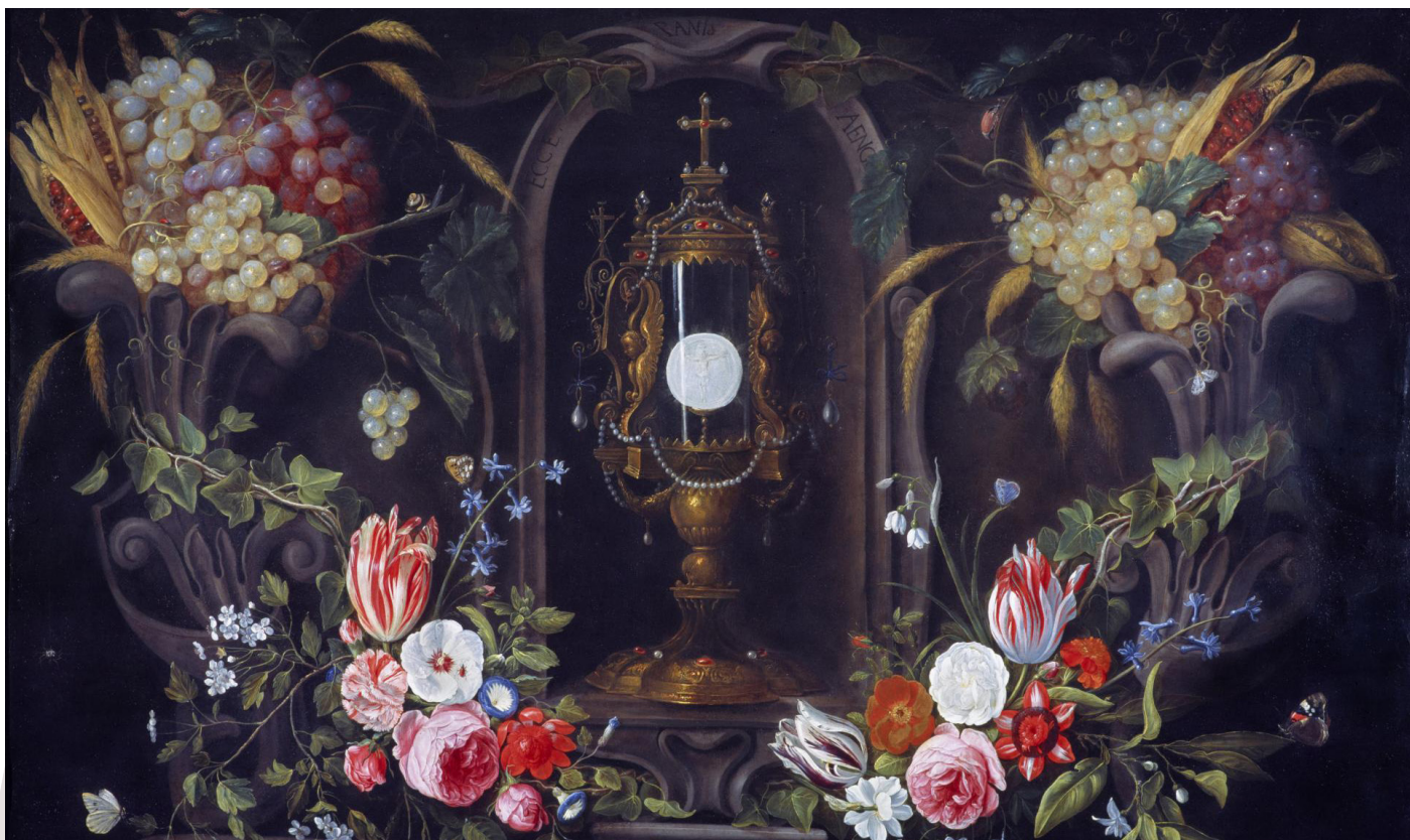
Naturaleza muerta de flores y uvas rodeando una custodia en un nicho, Jan van Kessel el viejo, 1670 ca. Extraído de la colección digital de la Galería nacional escocesa.