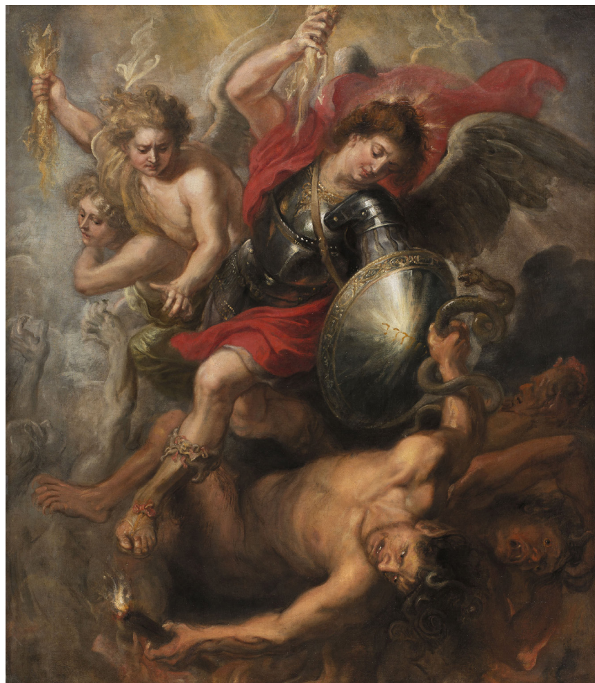
San Miguel expulsando a Lucifer y a los ángeles rebeldes, Taller de Pedro Pablo Rubens, óleo sobre lienzo, 1622 ca.

—Si estás dispuesto a ello, colaboraré contigo.